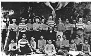
Αναμνηστική φωτογραφία από τα γυμνασιακά χρόνια του Νίκου Καζαντζάκη, 1898 (Ηράκλειο, Ιστορικό Μουσείο Κρήτης)

[...] Ώρες μάς έπαιρνε [ο δάσκαλος] τ' αυτιά ποια φωνήεντα είναι μακρά, ποια βραχέα και τι τόνο να βάλουμε, οξεία ή περισπωμένη. Κι εμείς ακούγαμε τις φωνές στο δρόμο, τους μανάβηδες, τους κουλουρτζήδες, τα γαϊδουράκια που γκάριζαν και τις γειτόνισσες που γελούσαν και περιμέναμε πότε να χτυπήσει το κουδούνι, να γλιτώσουμε. Κοιτάζαμε το δάσκαλο να ιδρώνει απάνω στην έδρα, να λέει, να ξαναλέει και να θέλει να καρφώσει στο μυαλό μας τη γραμματική, μα ο νους μας ήταν έξω στον ήλιο και στον πετροπόλεμο. Γιατί πολύ αγαπούσαμε τον πετροπόλεμο και συχνά πηγαίναμε στο σχολειό με το κεφάλι σπασμένο. Μια μέρα, ήταν άνοιξη, χαρά Θεού, τα παράθυρα ήταν ανοιχτά κι έμπαινε η μυρωδιά από μian ανθισμένη μανταρινιά στο αντικρινό σπίτι. Το μυαλό μας είχε γίνει κι αυτό ανθισμένη μανταρινιά και δεν μπορούσαμε πια ν' ακούμε για οξείες και περισπωμένες. Κι ίσια ίσια ένα πουλί είχε καθίσει στο πλατάμι της αυλής του σχολειού και κελαιδούσε. Τότε πια ένας μαθητής, χλωμός, κοκκινομάλλης, που 'χε έρθει εφέτος από το χωριό, Νικολιό τον έλεγαν, δε βάσταξε, σήκωσε το δάχτυλο: – Σώπα, δάσκαλε, φώναξε. Σώπα, δάσκαλε, ν' ακούσουμε το πουλί!