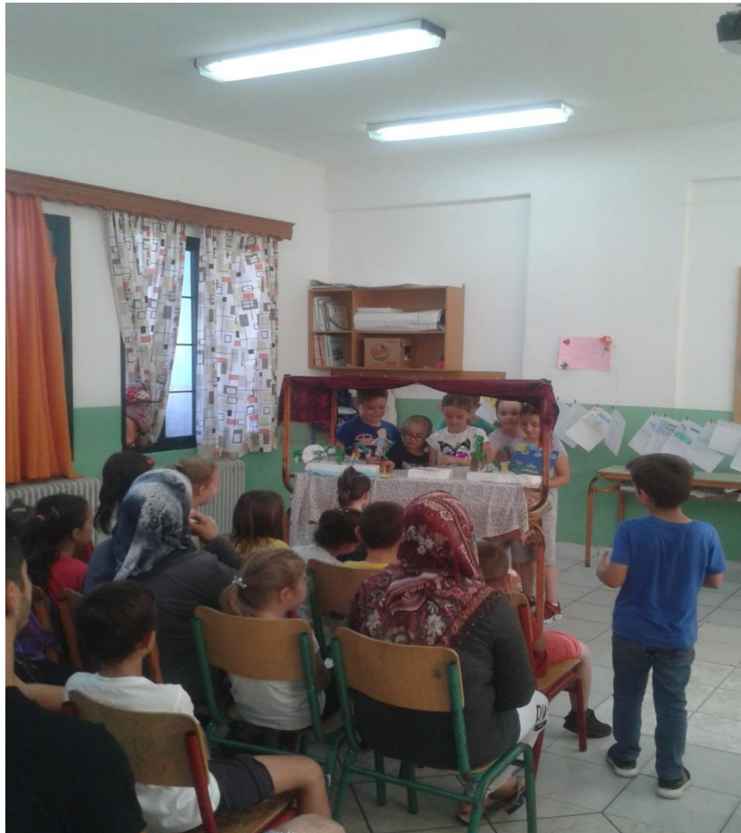
Παιδιά Β' δημοτικού προετοιμάζουν την παράσταση του κουκλοθεάτρου

Σε αρκετές τάξεις των μικρών παιδιών οι γονείς είχαν την ευκαιρία να παρακολουθήσουν τα παιδιά τους να παίζουν κουκλοθέατρο. Στο κουκλοθέατρο αναπαριστούσαν παραμύθια που είχαν επεξεργαστεί αξιοποιώντας διαλόγους είχαν φτιάξει τα ίδια.