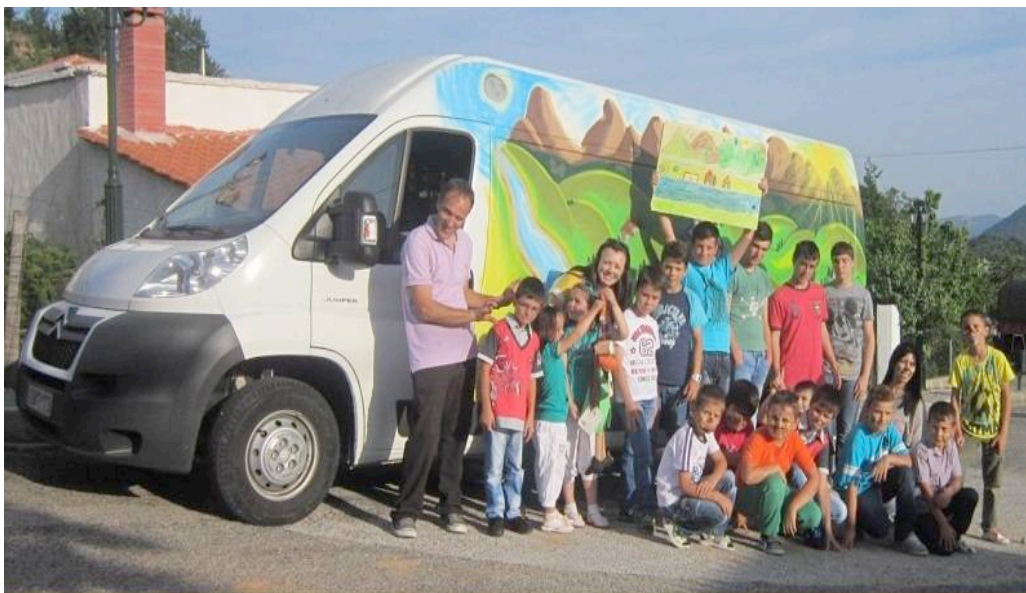
"Δ.Ε.Ν. ταξιδεύουμε!" - δράση του βαν των ΔΕΝ 2013-2015

Εδώ βλέπετε ένα βαν που ανήκε στη δράση, το έχουν βάψει τα ίδια τα παιδιά, και η ιδέα ήταν η επίσκεψη του σε διάφορους οικισμούς. Πάρκαρε στο κέντρο του χωριού και αυτόατα αποτελούσε κέντρο του ενδιαφέροντος. Οι εμπυχωτές εξηγούσαν τον σκοπό των ΔΕΝ και περιέγραφαν τί θα μπορούσαν να προσφέρουν στο χωριό. Μάζευαν ιδέες και αιτήματα και στη συνέχεια επέστρεφαν για την υλοποίηση δράσεων που ξεκινούσε από το αίτημα από τα κάτω.