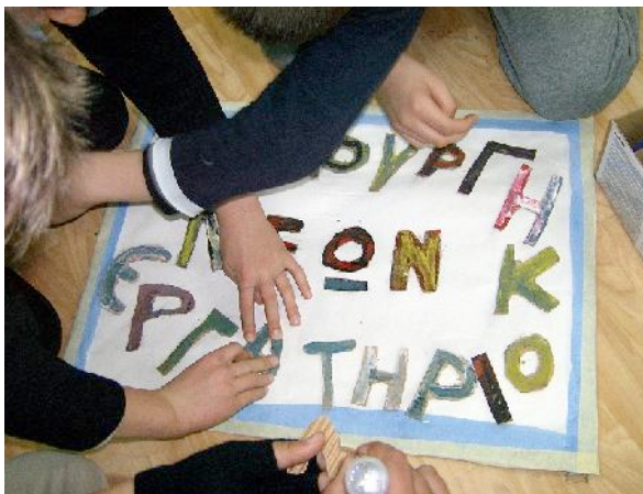
"Ένα δικό μας εργαστήρι" - ΔΕΝ Γλαύκης 2007

Είναι τα λόγια ενός νέου εμπυχωτή σε μια απολογιστική συνάντηση των εμπυχωτών των Δημιουργικών Εργαστηρίων Νέων. Τα Δημιουργικά Εργαστήρια Νέων, τα ΔΕΝ όπως τα βάφτισαν τα