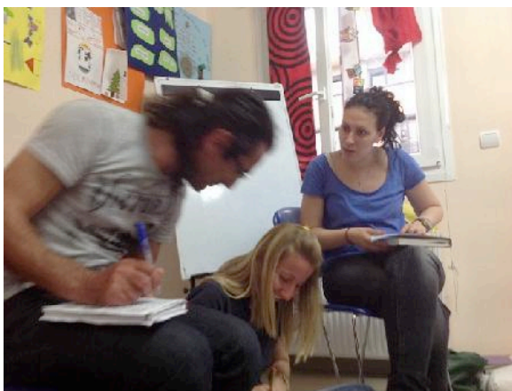
...συντονίζοντας τη δράση...