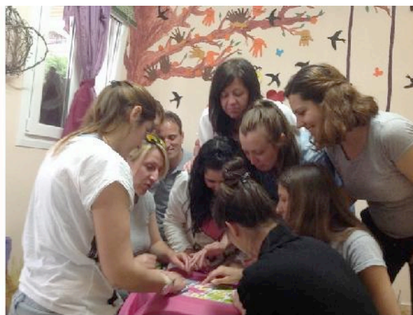
...εμπυχωώντας τη δράση...