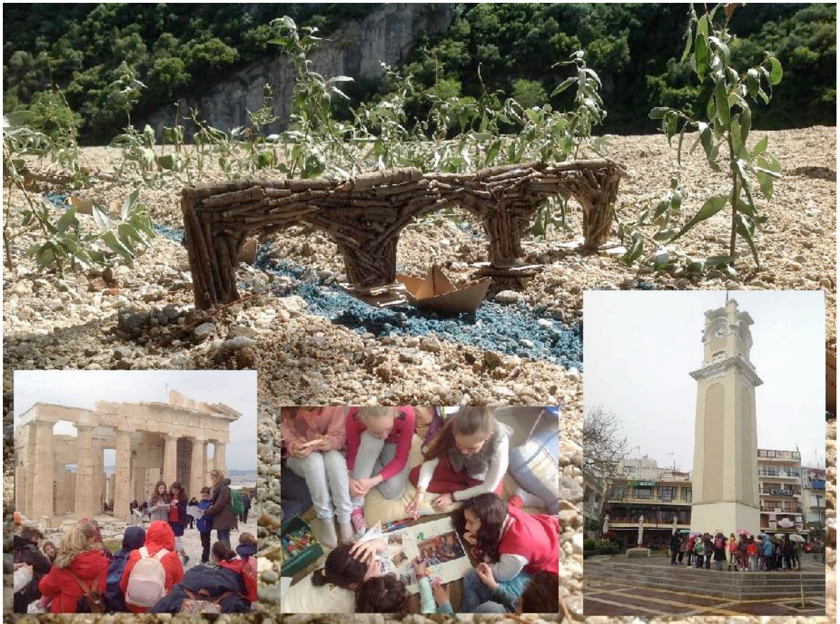
"Γέφυρες" - δράση ανταλλαγής νέων ΔΕΝ-Σχολής Χιλλ Νέστος-Σαλαμίνα, Αθήνα, Θράκη 2014-2015

βοηθάει να αναγνωρίζουν τις επιθυμίες τους, τις ανάγκες τους και τα ενδιαφέροντά τους. Παράλληλα τους μαθαίνει να δουλεύουν μόνοι αλλά και να εμπλέκονται σε έναν δημιουργικό διάλογο στα πλαίσια της ομάδας κατανοώντας τη διαπραγμάτευση που απαιτεί η συλλογική δουλειά. Από το αυτάρκες «εγώ» στο συλλογικό «εμείς».