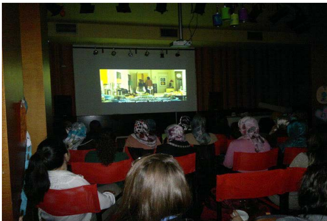
Η «πολίτικη κουζίνα» στο ΚΕΣΠΙΕΜ Κομοτηνής.

Σημαντικός επίσης ήταν ο ρόλος των εκπαιδευτικών εκδρομών οι οποίες θεωρούμε ότι προσέφεραν μια «χρυσή ευκαιρία» για ένα ευρύτερο άνοιγμα των γυναικών στον κόσμο, εκτός Θράκης. Οι γυναίκες περίμεναν πάντα με μεγάλη ανυπομονησία την εκδρομή και τη θεωρούσαν ως σημαντική στιγμή στη ζωή τους.