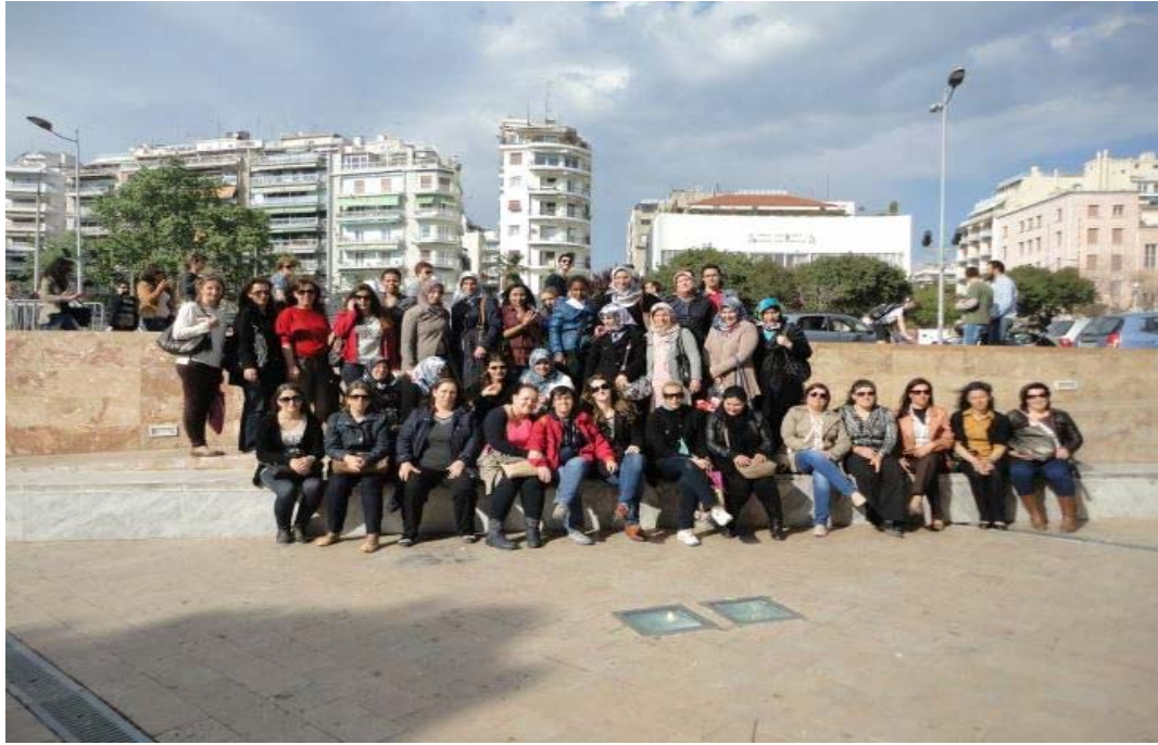
Από την εκδρομή στη Θεσσαλονίκη.