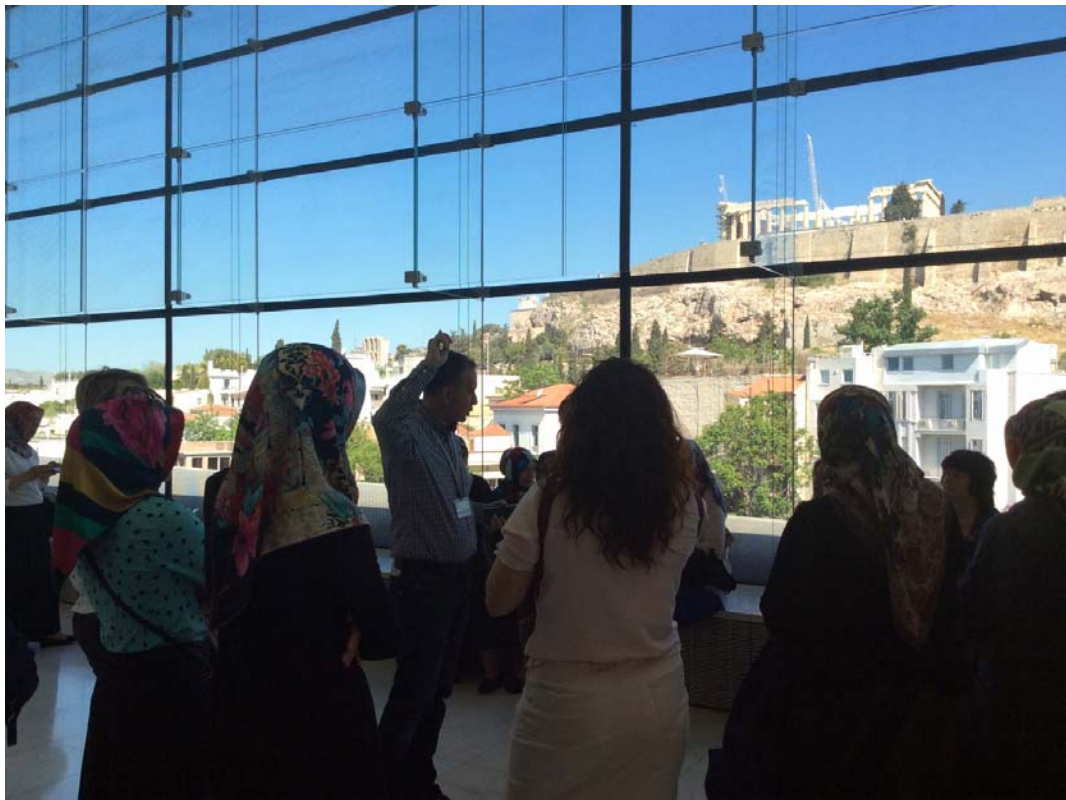
Στο μουσείο της Ακρόπολης