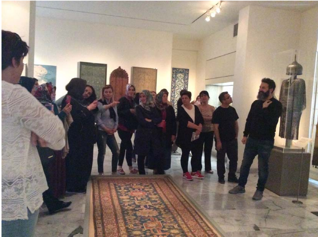
Στο μουσείο Ισλαμικής Τέχνης