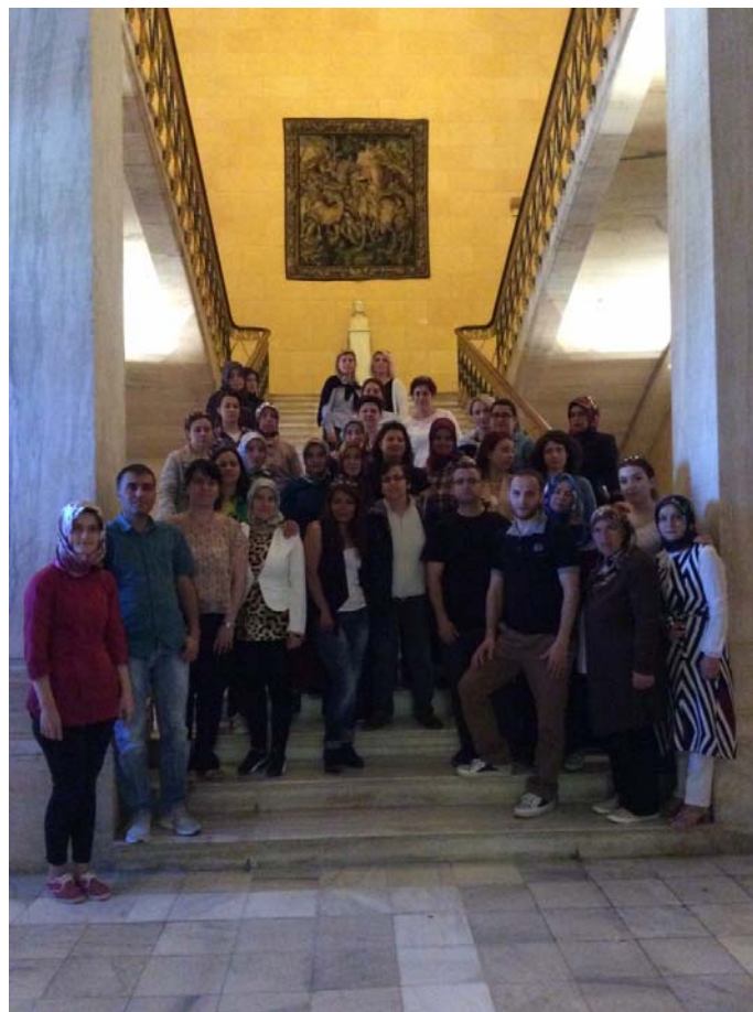
Στη Βουλή των Ελλήνων.

καταφέρουν να έρθουν γυναίκες που μέχρι πριν λίγο δυσκολεύονταν να συμμετάσχουν και σε μία απλή ημερήσια εκδρομή; Να αφήσουν πίσω τα σπίτια τους, τα παιδιά τους και τους άνδρες τους και να κάνουν κάτι για τον εαυτό τους»; Αποφασίσαμε να το επιχειρήσουμε και εντέλει 33 άτομα, 30 γυναίκες και 3 άνδρες κατάφεραν να ξεπεράσουν όλα τα προσωπικά εμπόδια και να συμμετάσχουν στην εκδρομή αυτή. Η συγκεκριμένη εμπειρία ήταν συγκλονιστική για όλες όσες συμμετείχαμε. Το πρόγραμμα περιελάμβανε ξενάγηση στη Βουλή των Ελλήνων, με υποδοχή από δύο μειονοτικούς βουλευτές, στο μουσείο ισλαμικής τέχνης καθώς και στο μουσείο της Ακρόπολης.