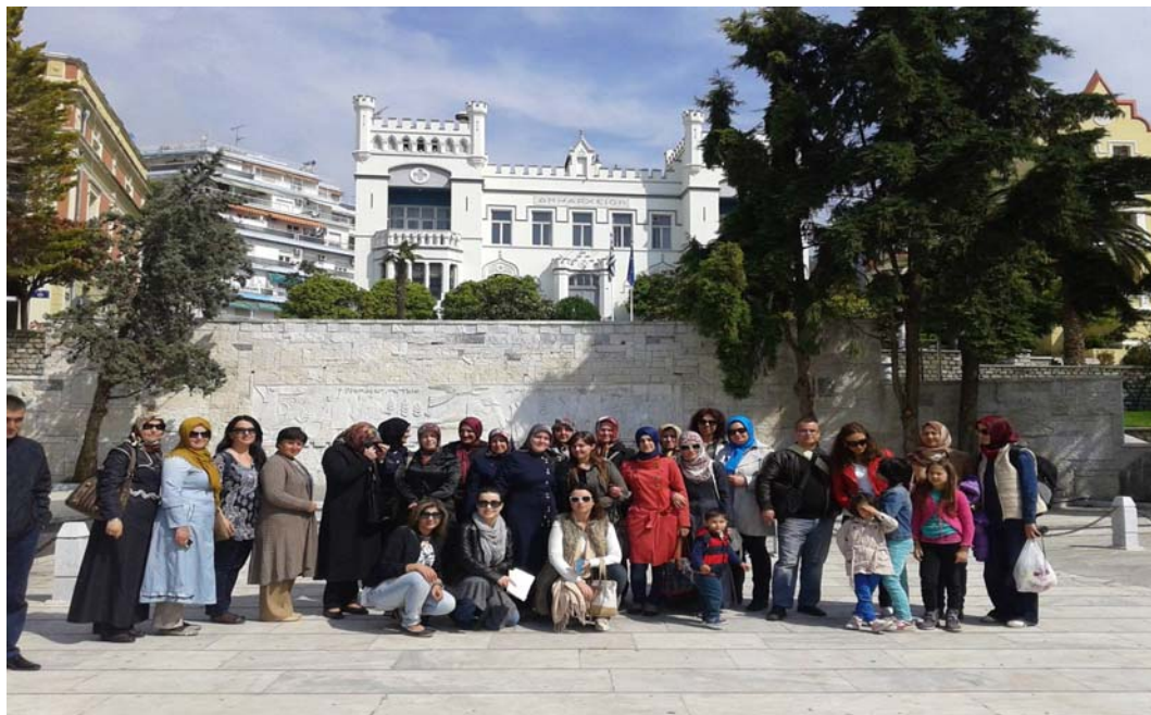
Από την εκδρομή στην Καβάλα.

Το Μάιο του 2015 οργανώσαμε μια εκπαιδευτική εκδρομή στην Καβάλα, με ξενάγηση στην πόλη και επίσκεψη στο μουσείο καπνού και σε άλλα αξιοθέατα. Συμμετείχαν 92 εκπαιδευόμενοι, 89 γυναίκες και 3 άνδρες και χάρηκαν πολύ όλη την εμπειρία της εκδρομής.