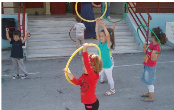
Φωτ. 5: Τα παιδιά μέσα από το παιχνίδι έρχονται σε επαφή με την ελληνική γλώσσα και αποκτούν κίνητρο να την κατανοήσουν.

παιδιά βασική επιδίωξη ήταν να θελήσουν να εκφράσουν σκέψεις και ιδέες στα ελληνικά, αλλά και να μπορούν να ανταποκρίνονται σε οδηγίες για την ανάπτυξη παιχνιδιών και δραστηριοτήτων που δίνονται στην ελληνική γλώσσα. Για λόγο αυτό χρησιμοποιήθηκαν ελκυστικά υλικά, τα οποία μαθαίνουν να αξιοποιούν για να αναπαραστήσουν π.χ. τα μέλη της οικογένειάς τους και να μιλήσουν γι αυτά, ή αναπτύσσονται παιχνίδια που οι οδηγίες για την ανάπτυξή τους δίνονται στην ελληνική γλώσσα. Στα λίγο μεγαλύτερα παιδιά δόθηκε ιδιαίτερη έμφαση στην ανάπτυξη της σχέσης με τα βιβλία. Σε αυτή την προοπτική διάβασαν και επεξεργάστηκαν βιβλία, αλλά και συζήτησαν σχετικά με τα βιβλία.